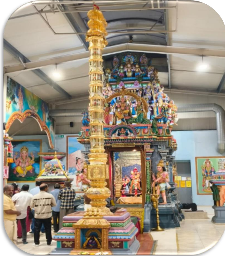
படம் 6: அழகிய சுவிஸ் மண்ணில் முருகனின் கோவில்

படம் 5: கோவிலின் கொடிமரமும் முக்கிய சந்நிதானமும்